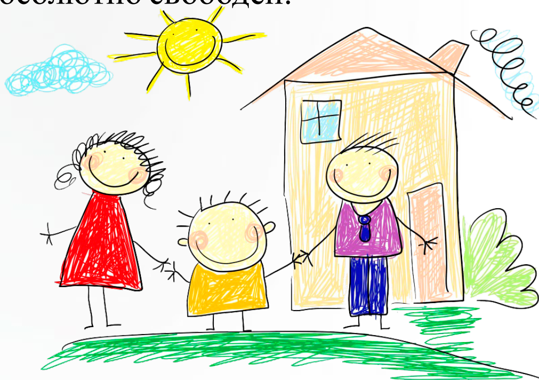
Рисунок для ребенка является не искусством, а речью. Рисование дает возможность выразить то, что в силу возрастных ограничений он не может выразить словами. В процессе рисования рациональное уходит на второй план, отступают запреты и ограничения. В этот момент ребенок абсолютно свободен.

Детский рисунок чаще всего наглядно демонстрирует сферу интересов самого маленького художника. Мы как родители и педагоги можем много нового узнать о своих детях, если понаблюдаем за ними во время рисования.